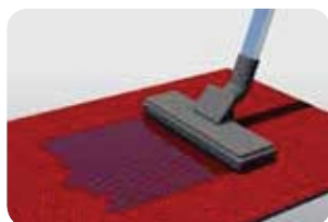
Periodiek reinigen met sproeiextractiemethode