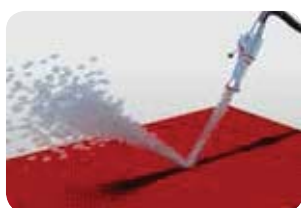
Periodiek met water en zeep schoonspuiten