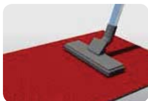
Dagelijks de bovenzijde stofzuigen