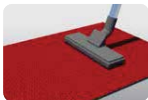
Dagelijks de bovenzijde stofzuigen